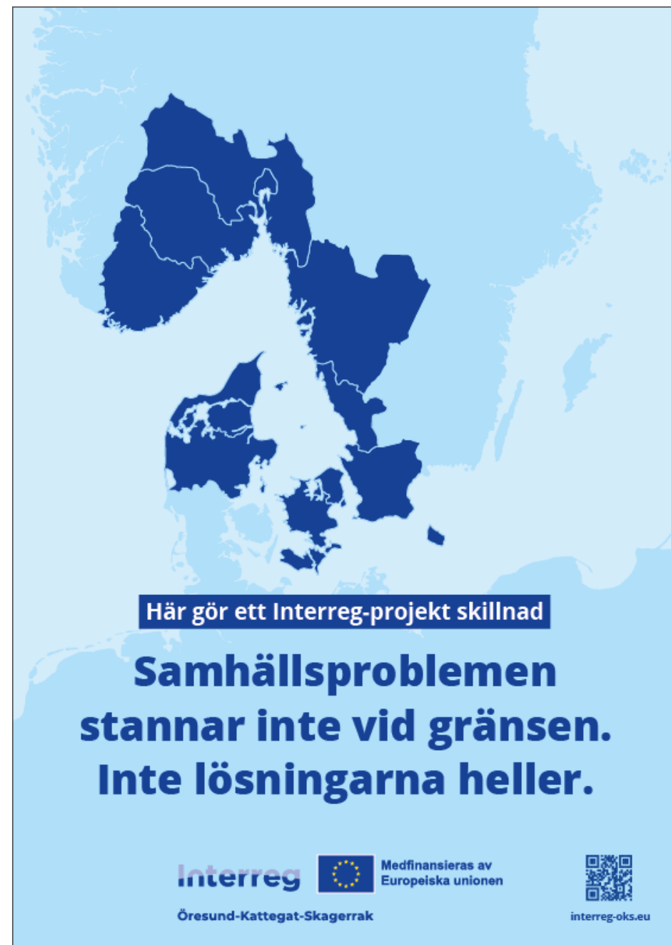
1) Udskrift af A3-plakat.